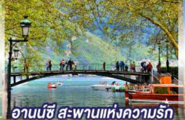
อานน์ซี สะพานแห่งความรัก