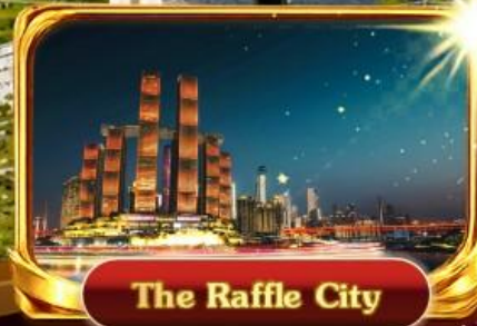
The Raffle City