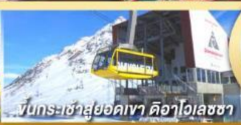
ขึ้นกระเช้าสู่ยอดเขา ดือาไวเลซซา