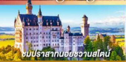
ชมปราสาทนอยชวานสไตน์