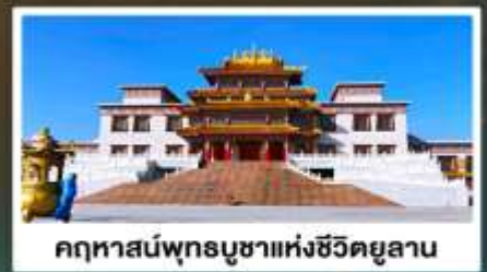
คฤหาสน์พุทธบูชาแห่งชีวีคยูลาน

พักโรงแรมพื้นเมือง สนทนกับชนเผ่า มีคองน้ำไมคัว