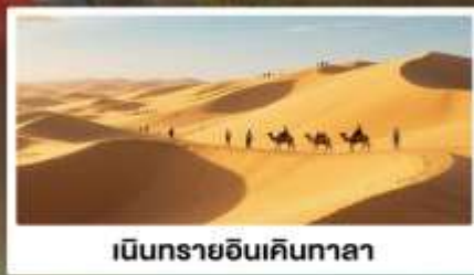
เมืองทรายอินเคินกาลา