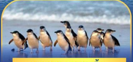
พาเหรดนกเพนกวิน