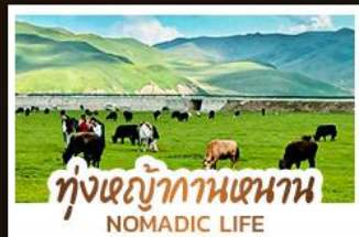
ทุ่งหญ้ากานหนาน NOMADIC LIFE