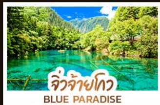
จิวจ้ายโกว BLUE PARADISE