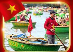
เรือกระด้ง หมู่บ้านกัมทาน