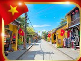
เมืองมรดกโลก ฮอยอัน