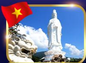
ชมพระอภิมหาอิม วัดหลินอึ้ง