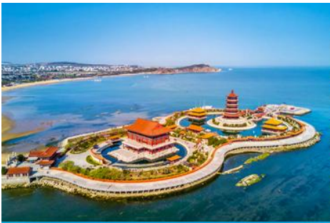
อุทยานท่องเที่ยวแปดเซียนข้ามทะเล