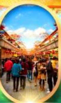
ถนนนากามิยะ