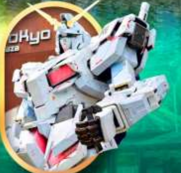
ห้างโอโดบะกินคัม