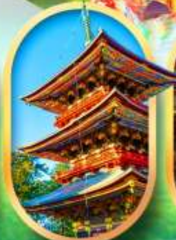
วัดนาริตะ-ซัง