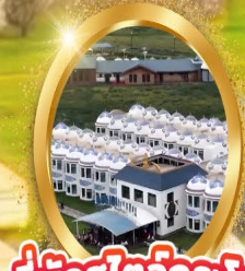
ที่พักสไตล์กริมโรว์