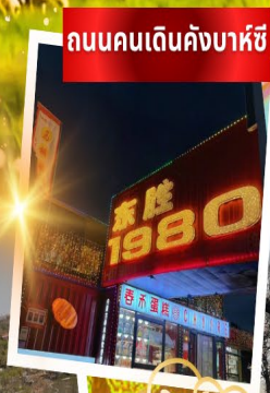
ถนนคนเดินคังบาหิซี