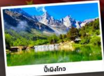
ปี้เฉิงโกว