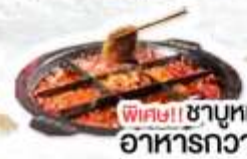
พิเศษ!! ซาฮูหม่าล่า อาหารกวางตุ้ง