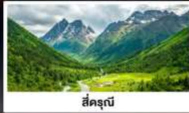
สี่ดรุณี