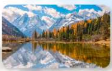
สี่ครุณี