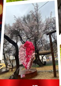
สวนแอปริคอต