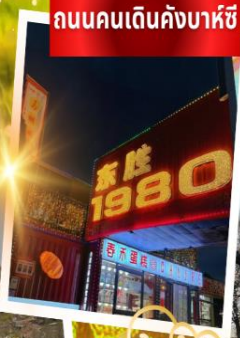
ถนนคนเดินคังบาหิซี