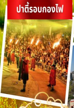
ปาร์ตี้รอบกองไฟ