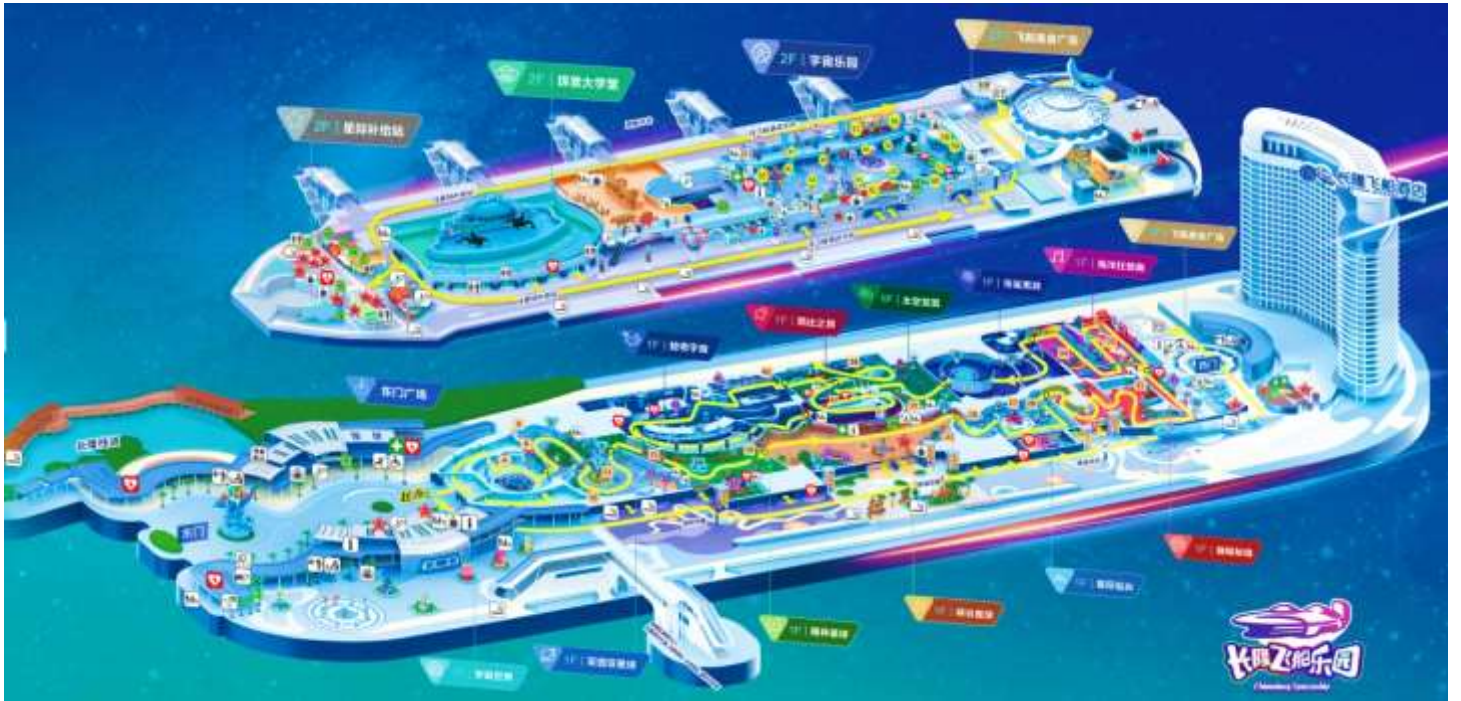
แผนที่ CHIMELONG SPACESHIP PARK