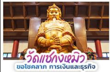
วัดแห่งกวมิว ขอโชคกลาง การเงินและธุรกิจ