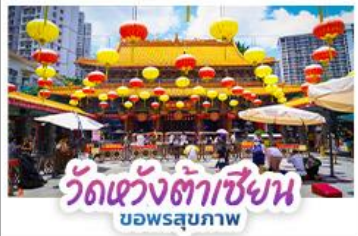
วัดแห่งต้าเซียน บอพรสุขภาพ