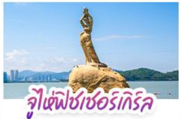
จุฬาราชมนตรี