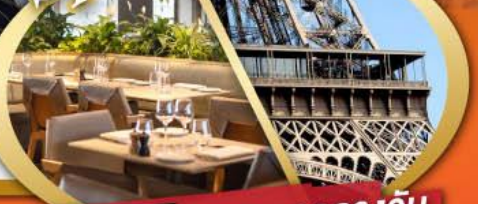
รับประทานอาหารกลางวัน บนหอคอยเฟล

ไฮไลท์ในโปรแกรม • สะพานไม้ชาเปล ลูเซิร์น