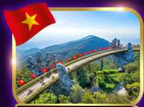
สะพานมือสีทอง บานาฮิลล์