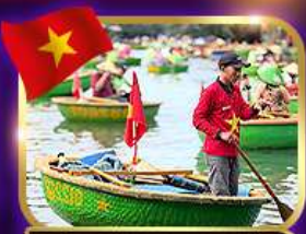
เรือกระด้ง หมู่บ้านกิมกาน