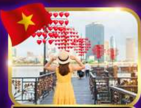
เช็คอินสะพานแห่งความรัก