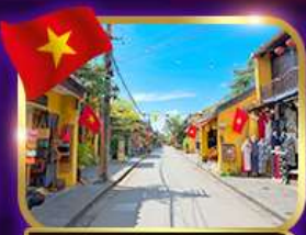
เมืองเก่ามรดกโลก ฮอยอัน