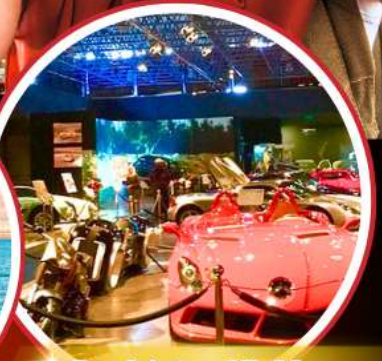
Royal Automobile Museum

ROYAL JORDANIAN AIRLINES BOEING 787 DREAMLINER น้ำหนักกระเป๋า 30 กิโลกรัม