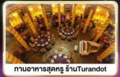
กานอาหารสุดหรู ร้านTurandot