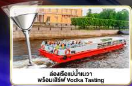
ล่องเรือแม่น้ำแคว พร้อมเสิร์ฟ Vodka Tasting