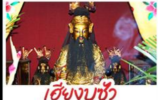
เอียงบูชิว