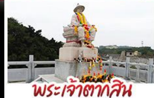
พระเจ้าตากสิน