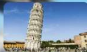
ทาวน์บิซ่า