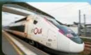
นั้งรถไฟความเร็วสูง TGV