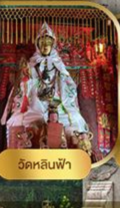
วัดหลันฟ้า