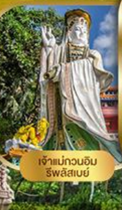
เจ้าแม่กวนอิม ริวสิสเมย์