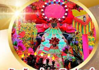
วัดเจ้าแม่กวนอิมฮ่องกง

ขอพรเจ้ากวนอู ความซื่อสัตย์ เงินทอง ธุรกิจมั่นคง