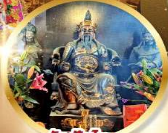
วัดปึกโต

เสริมโชคลาภนำความรุ่งเรือง ทุกด้านของชีวิต