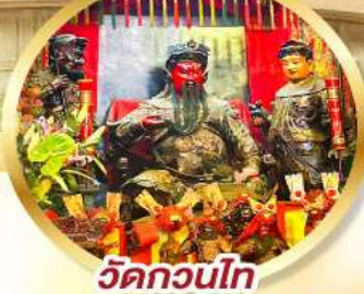
วัดกวนไท่

ขอพรเจ้ากวนอู ความซื่อสัตย์ เงินทอง ธุรกิจมั่นคง