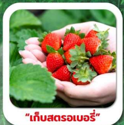
"เก็บสดเบอร์รี่"

T2G-KMG14KY POPULAR KUNMING คุณหมิง ภูเขาหิมะเจียวจื่อ เขาซีซาน 4D 3N (KY)