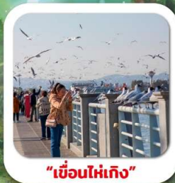
"เขื่อนไห่เกิง"