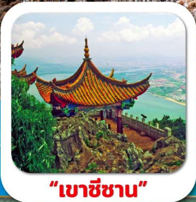
"เขาซีซาน"

4 วัน 3 คืน 昆明航空 สายการบิน KUNMING AIRLINE (KY)