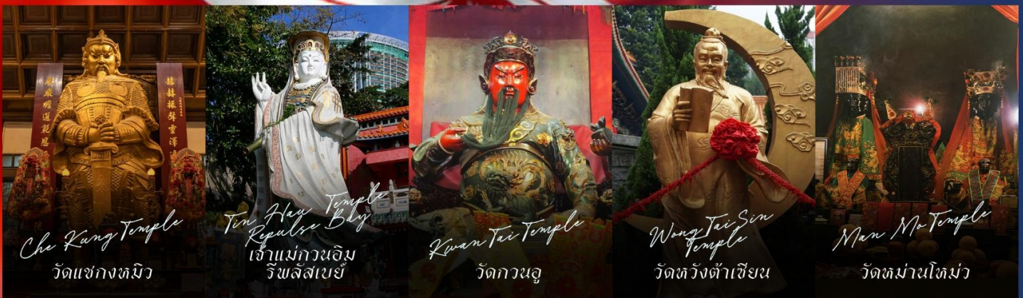
Che Kung Temple วัดแซงทมิว

รายการทัวร์ข้างต้นอาจมีการปรับเปลี่ยนเพื่อความเหมาะสม