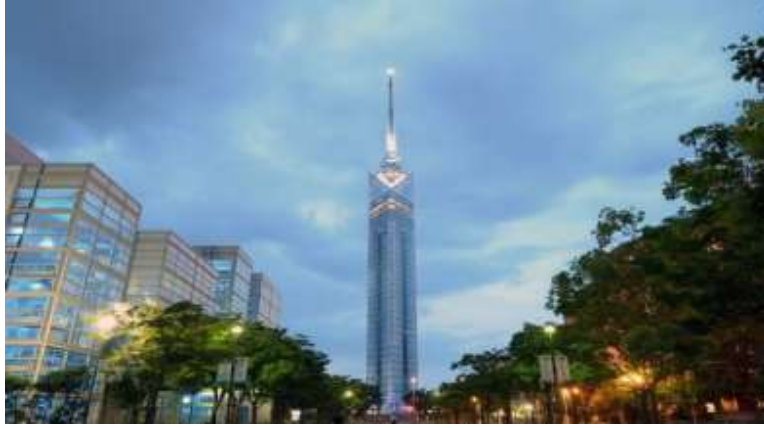
Fukuoka Tower หอคอยตึกระฟ้าที่สูงที่สุดในประเทศญี่ปุ่นถึง 234 เมตร

สถานที่ท่องเที่ยวที่ได้รับความนิยมมากที่สุดในฟูกูโอกะ: