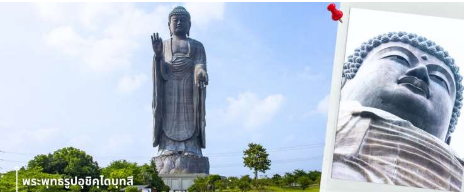
พระพุทธรูปอูชิคุไดบุทสึ

หลังรับประทานอาหารเช้าเที่ยง นำท่านเดินทางชม พระพุทธรูปปางยืน ที่องค์ใหญ่ติดอันดับโลก นั่นก็คือ พระพุทธรูป อูชิคุไดบุทสึ โดยในปี ค.ศ.1995 ได้รับการบันทึกลงในกินเนสบุ๊กว่า เป็นพระพุทธรูปปางยืนที่หล่อด้วยสัมฤทธิ์ที่สูงที่สุดในโลก โดยสูงถึง 120 เมตร และยังสูงเป็นอันดับที่ 3 ของโลก พระพุทธรูปอูชิคุไดบุทสึ ถูกสร้างขึ้น ในปีค.ศ. 1992 บนพื้นที่บริสุทธิ์ของสุสาน และปีต่อมาก็ถูกทำให้เป็นสวนสาธารณะ และยิ่งไปกว่านั้น บริเวณรอบๆ พระพุทธรูปจะเป็นสวนสาธารณะ ที่มีการปลูกดอกไม้ตามฤดูกาลไว้อย่างงดงาม ภายในสวนยังมีดอกไม้บานนานาพันธุ์ให้ท่านได้ชม ไม่ว่าจะเป็น ดอกไฮเดรนเยีย โบตัน ซากุระ ต้นฟลอกสมอส ป๊อบบี้ และคอสมอส เป็นต้น ซึ่งสลับกันแบ่งบานตลอดทั้งปี แต่ทั้งนี้ก็จะขึ้นอยู่กับฤดูกาลและชนิดของดอกไม้ ให้ท่านได้อิสระเดินชมและเก็บภาพความประทับใจ