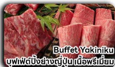
Buffet Yakiniku บุฟเฟ่ต์ปิ้งย่างญี่ปุ่นเนื้อพรีเมียม