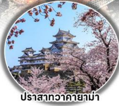
ปราสาทอากายาฆ่า