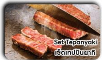
Set Teppanyaki เซตเทปปิงซากิ