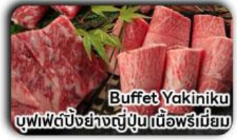
Buffet Yakiniku บุฟเฟต์ปิ้งย่างญี่ปุ่นเนื้อพรีเมียม