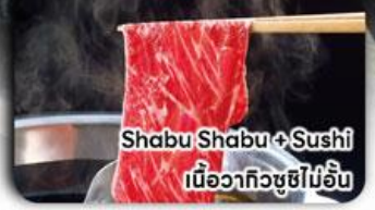
Shabu Shabu + Sushi เนื้อวากิวซูชิไม่อื่น