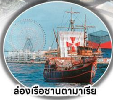
ล่องเรือซานตามาเรีย