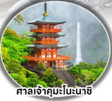
ศาลเจ้าคุมะโนะนาชิ