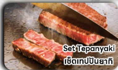
Set Tepanyaki เซตเทปียนยากิ