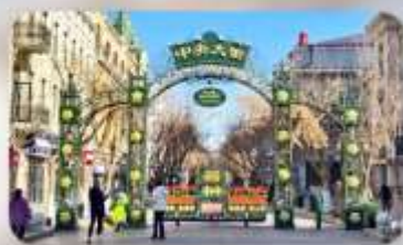
ถนนจงหยาง