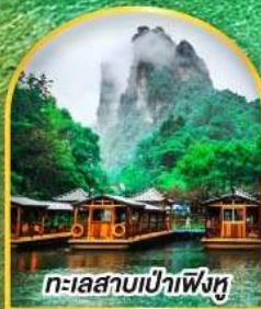
ทะเลสาบเป่าเฟิงหู