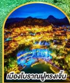
เมืองโบราณฟูหลงจัน