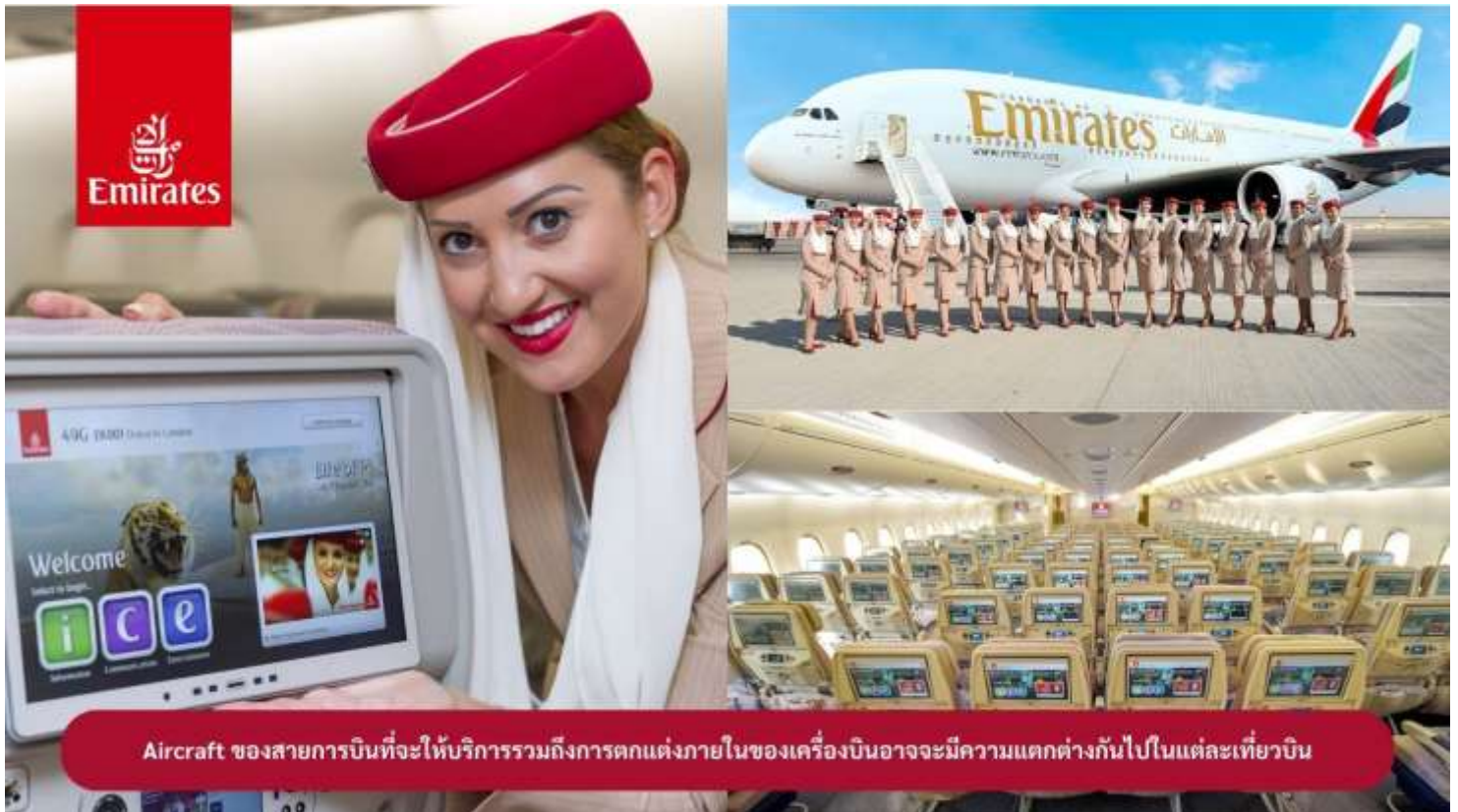
Aircraft ของสายการบินที่จะให้บริการรวมถึงการตกแต่งภายในของเครื่องบินอาจจะมีความแตกต่างกันไปในแต่ละเที่ยวบิน

23.00 น. !!!! ขณะเดินทางพร้อมกัน ณ สนามบินสุวรรณภูมิ อาคารผู้โดยสารขาออกระหว่างประเทศ ชั้น 4 ประตู 9 แถว T สายการบินเอมิเรตส์ แอร์ไลน์ (EK) เจ้าหน้าที่ให้การต้อนรับและอำนวยความสะดวก