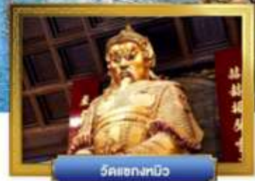
วัดเขกงทิว