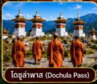
โดจุลาพาส (Dochula Pass)