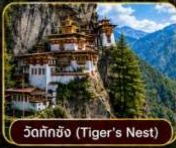
วัดทักซิง (Tiger's Nest)