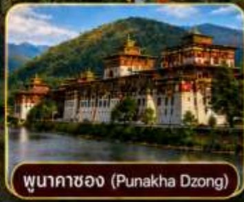
พูนาคาซอง (Punakha Dzong)