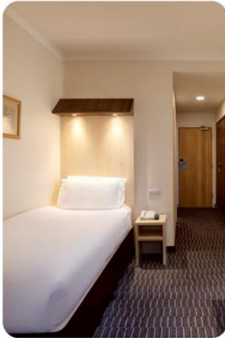
ห้องพัก สำหรับ 1 ท่าน SINGLE ROOM (SGL)