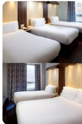
ห้องพัก สำหรับ 3 ท่าน TRIPLE ROOM (TRP)

กรณีห้อง Twin Bed ของทางโรงแรมไม่มีหรือเต็ม ทางบริษัทขอปรับเป็นห้อง Double Bed แทน หรือ หากต้องการห้องพักแบบ Double Bed ของทางโรงแรมไม่มีหรือเต็ม ทางบริษัทขอปรับเป็นห้อง Twin Bed แทน และหากต้องการพักแบบ Triple Room ของทางเราไม่มีหรือเต็ม ทางบริษัทขอปรับเป็นห้อง 1 เตียงใหญ่ (Queen Size) + 1 เตียงเล็กแทน โดยมีต้องแจ้งให้ทราบล่วงหน้า