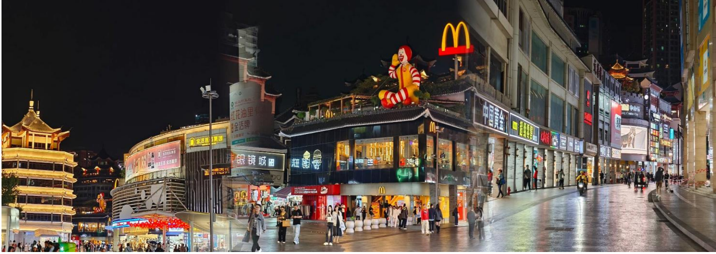
ค่ำ รับประทานอาหารเย็น ณ ภัตตาคาร เมนู Hot Pot ปิ้งย่างบุฟเฟต์ เครื่องดื่ม เบียร์ไวน์ไม่อั้น (มีทั้งหมด , เนื้อ , อาหารทะเล)